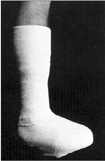
Fig. 4. Example of total contact cast.