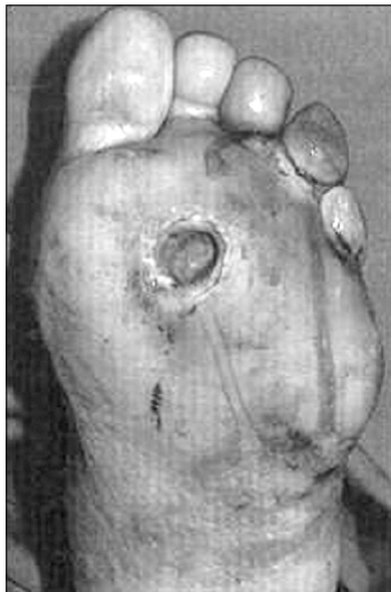
Fig. 2. Example of iabetic forefoot ulcer.

크게 신경병성 궤양과 혈관의 문제에 의한 궤양으로 구분할 수 있다. 이 두 질환은 임상 양상 및 치료의 방침이 확연히 다르기 때문에 반드시 구분을 하여 치료 방침을 세워야 한다. 10